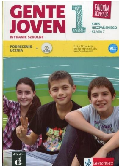
Podręcznik Gente Joven 1