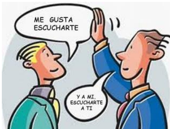
Rozmowy z kolegami i nauczycielem