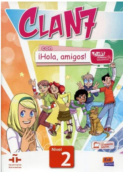
Podręcznik Clan 7 Nivel 2