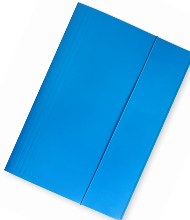
Teczka na materiały dodatkowe