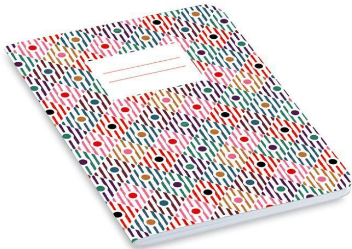
Zeszyt w kratkę lub w linie (32 kartkowy)