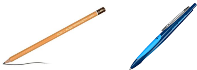
Ołówek lub długopis ścieralny