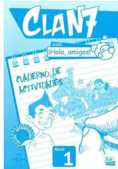
Ćwiczenia Clan 7 Nivel 1